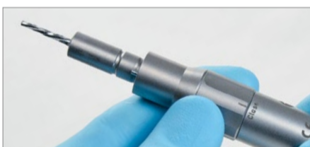
Chiudere l'anello di fissaggio del manipolo del craniotomo. Ora il trapano non può più essere estratto.