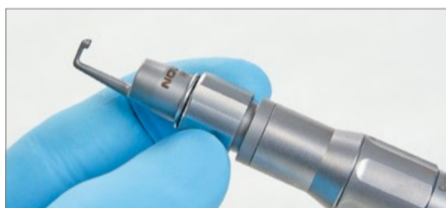
Attivare l'anello di chiusura del duraprotector.