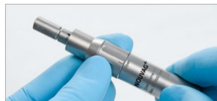
Aprire l'anello di fissaggio del manipolo del craniotomo.