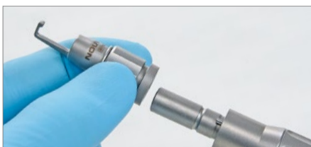
Staccare il duraprotector dal manipolo del craniotomo.