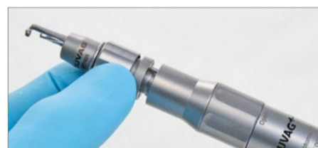
Riposizionare il duraprotector sul manipolo del craniotomo e stringere di nuovo l'anello di bloccaggio del duraprotector.