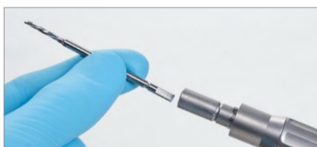
Infilare la fresa craniale nel dispositivo di serraggio del craniotomo e stabilizzarlo girando leggermente.